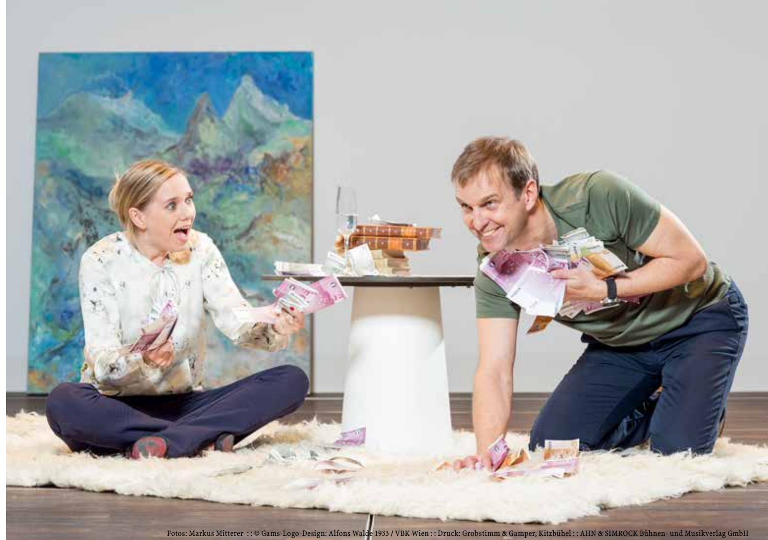
© Gams-Logo-Design: Alfons Walde 1933 / VBK Wien :: Druck: Grobstim & Gamper, Kitzbühel :: AHN & SIMROCK Bühnen- und Musikverlag GmbH

„Als ob es regnen würde“ ist eine höchst amüsante, spannende und intelligente Komödie über das Geld und über die Gier. Autor Sébastien Thiéry gelingt es mühelos, absurden Humor und Elemente des Boulevardtheaters miteinander zu verbinden. (Berliner Lokalnachrichten)